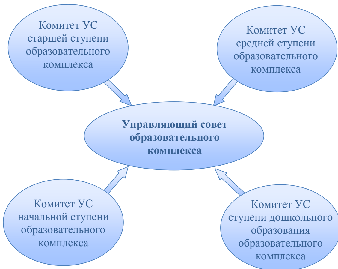
Рис.2. Управляющий совет образовательного комплекса. Второй вариант организации.

соответствующей ступени (структурного подразделения) – это вопрос открытый и ответ на него зависит от объема функций и полномочий комитета. То же самое можно сказать и в отношении «структурно-территориального» комитета, рассмотренного в первом варианте.